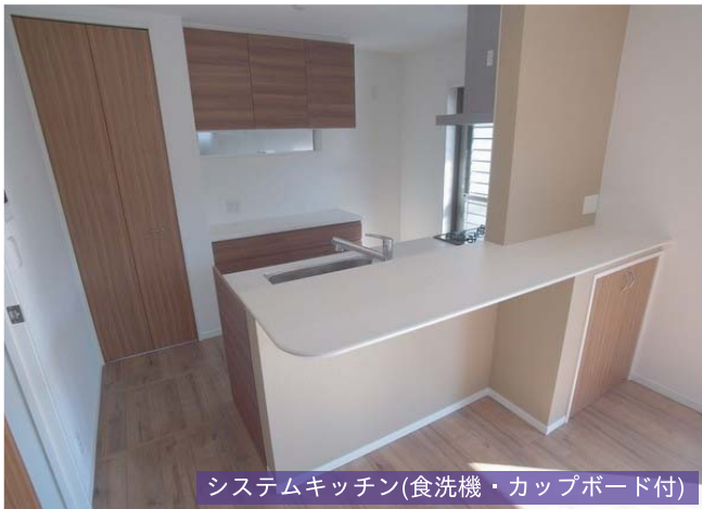
システムキッチン(食洗機・カップボード付)